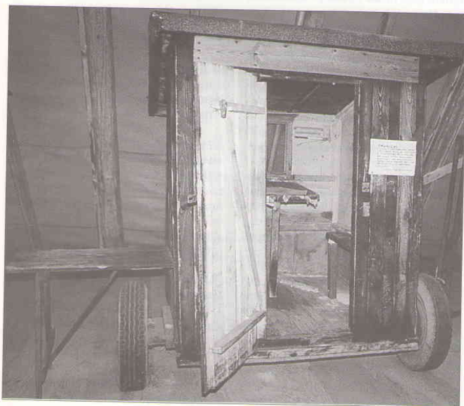
En af de senere og mere komfortable udgaver med både bund, hjul og træk.

brug som små brænde eller olieovne, og kun det, at husene stadig ikke var særlig tætte, forhindrede vel, at ingen omkom under brugen af omtalte ovne. I de senere år blev også disse huse dog opvarmet ved hjælp af gas. Nævnes skal det vel, at en del af spisehusene på Corselitze for isolationsens skyld, udvendig var beklædt med strå i lighed med husene i Hesnæs. ❀